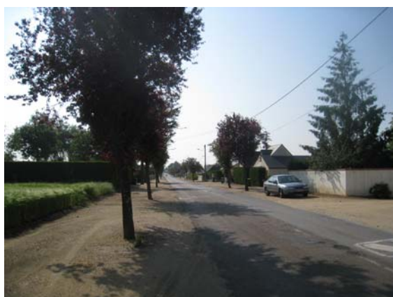
Rue Principale ouest Espaces délaissés - urbanisation continue