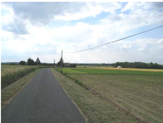
Ancien moulin sur la butte

L'autoroute A 85 traverse une partie du territoire au nord. Elle est parfaitement invisible, car totalement aménagée en déblai par rapport au plateau agricole.