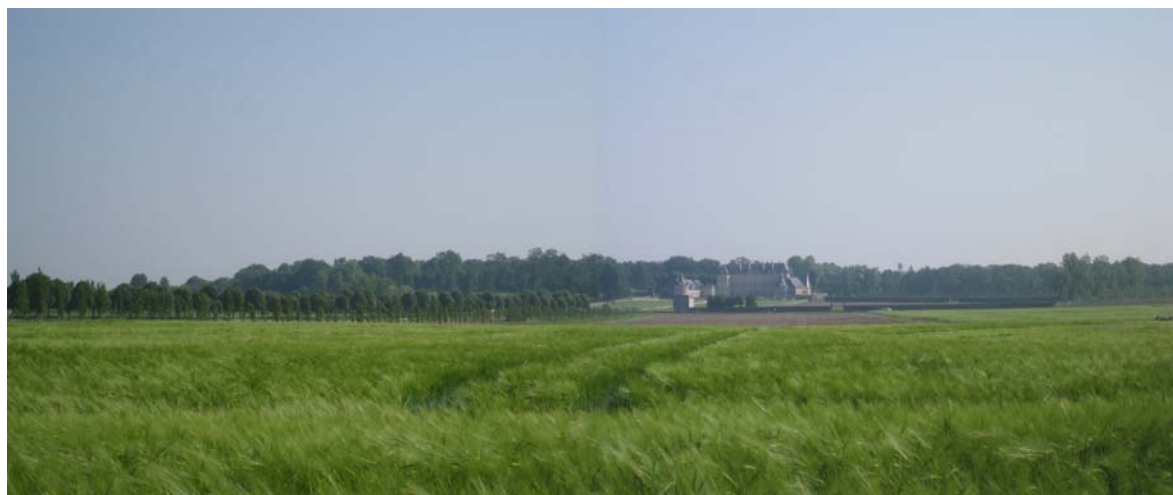
Montgeoffroy depuis la RD 347

C'est un élément capital du paysage de Mazé, imposant autant par son architecture que par sa localisation. Placé au centre gravitaire du territoire communal et sur la butte la plus avancée dans la vallée, il constitue un repère fort et signifiant.