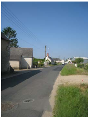
Route du Fayet Campagne ou ville ?

Malheureusement, cette percée visuelle qui menait le regard jusqu'au val d'Authion et au-delà vers le coteau sud de la Loire, est bloquée par l'installation d'une zone artisanale en bordure de la RD 347 dans l'axe du château.