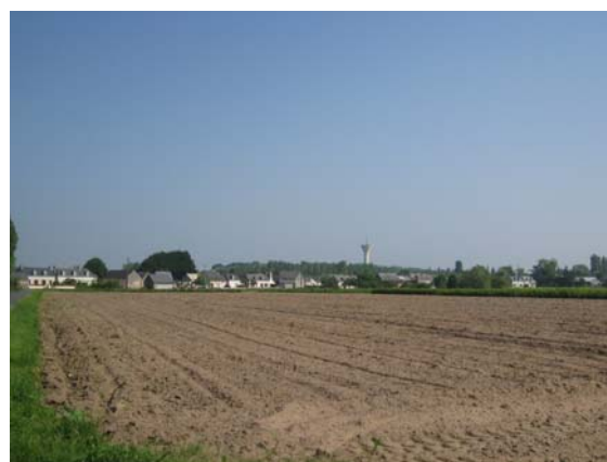
Front bâti - le Pâtis de la Noue