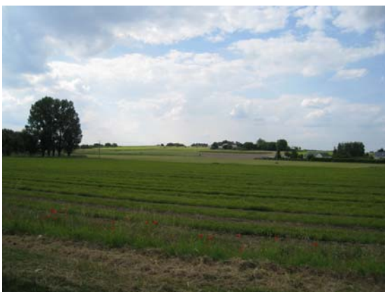
Ponctuation de l'habitat