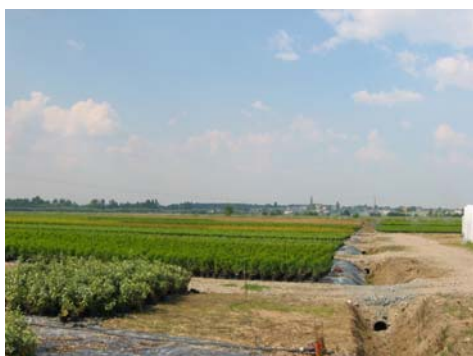
Rythme des cultures

Cette diversité apporte une diversité de couleurs et de textures, véritable patchwork, qui varie selon les saisons. Ces cultures alignées apportent des rythmes dans le paysage, introduisant une dynamique dans la perception, contrairement aux parcelles de prairies ou de céréales d'aspect uniforme.