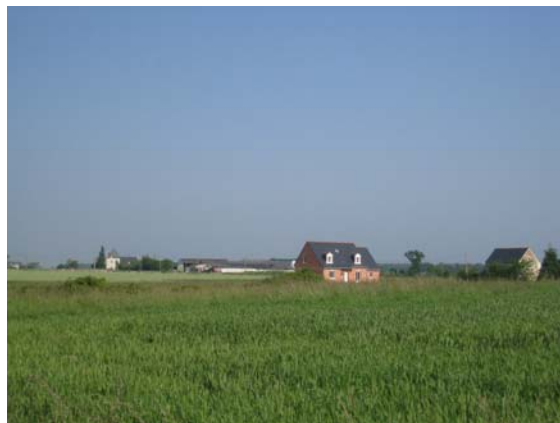
Les Touches - Maison neuve