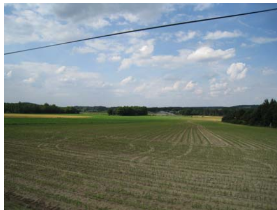
Paysage agricole limité par un fond boisé au nord