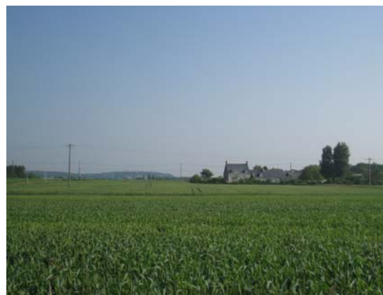
Paysage agricole aux Hautes Touches