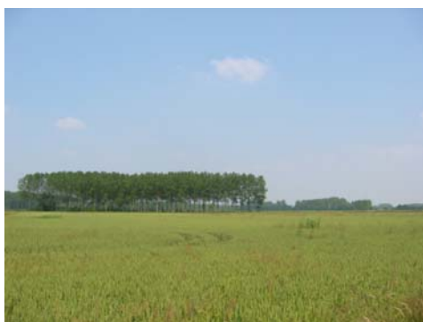
Paysage ouvert Ponctuation par une peupleraie

La verticalité dans le paysage est introduite sous différentes formes :