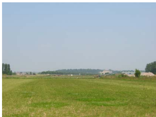
Perception de Montgeoffroy depuis la vallée

Par ses grandes allées d'arbres rayonnantes et descendantes, il constitue une liaison entre les contreforts boisés du Baugeois et la vallée de la Loire, passant au-dessus des secteurs urbanisés.