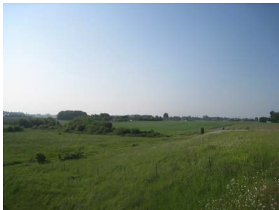
Plateau agricole - secteur des Touches depuis le pont sur l'A85