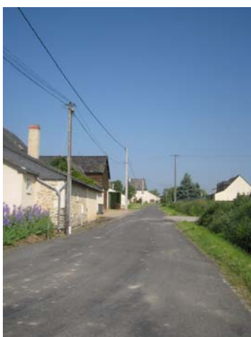
Route des Ruaux