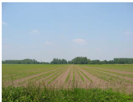
Platitudes du val d'Authion