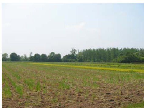
Diversité des couleurs et des textures

Cette vallée plate est cultivée. Elle est découpée en un parcellaire plus ou moins lâche. La particularité du val d'Authion est la diversité des cultures pratiquées : céréales, maïs mais aussi cultures spécialisées demandant plus ou moins de soin et en conséquence cultivées sur des surfaces plus petites.