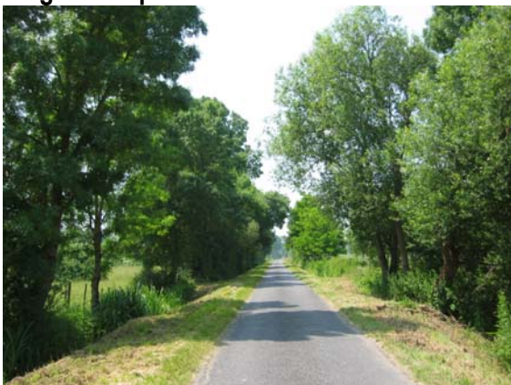
Paysage fermé, secteur du Vieil Authion Chemin sur digue