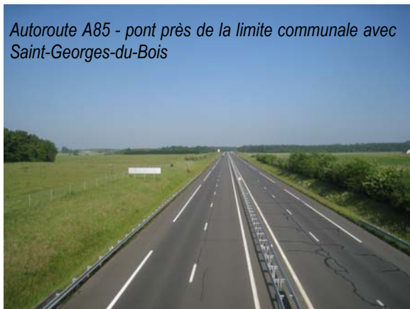
Autoroute A85 - pont près de la limite communale avec Saint-Georges-du-Bois

Bien qu'elle ne soit pas directement desservie par cet axe autoroutier (l'échangeur le plus proche est situé à Beaufort-en-Vallée), la commune doit en supporter les contraintes et nuisances puisqu'à l'instar de la RD n°347 le tracé de l'A85 induit :