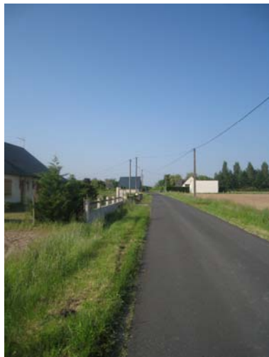
Chemin de Rigourde

Le piéton utilise pour l'essentiel les trottoirs ou accotements existants. Si cet usage ne pose pas de difficultés dans le centre-bourg où les trottoirs permettent une circulation piétonne aisée, elle paraît en revanche plus dangereuse le long des axes de circulation (route de Fayet, rue Chevreul, chemin de Rigourde...) où l'absence de traitement de l'espace public (accotement enherbé), combinée à la vitesse accrue des automobiles renforce le sentiment d'insécurité.