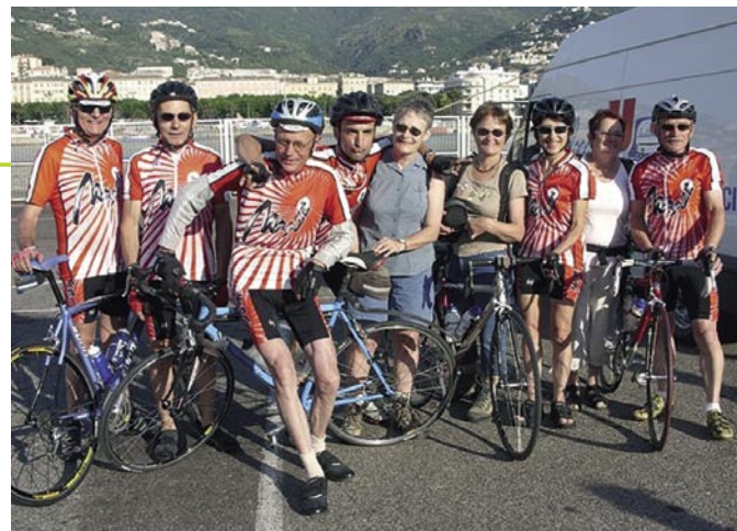
L'équipe de Mazé Athlétic Club en Corse.

Entre la mer et la montagne, la côte et les côtes, ils ont goûté, à la sueur de leurs fronts et de leurs jambes, la beauté et la diversité des paysages corses. Ce fut le littoral sauvage de l'ouest, les criques et les plages confidentielles, les ports de plaisance, les rochers ruiniformes, les falaises ocrées, les villages en surplomb dominant la mer, les tours génoises. Ce fut aussi la Corse intérieure et ses bastions identitaires, les vieilles villes séparées en quartiers par des ruelles étroites et escarpées, les villages reculés accrochés au flanc de la montagne avec leurs fiers campaniles, les élevages en pleine nature de vaches, moutons, cochons, les forêts et les maquis, des routes étonnamment tranquilles