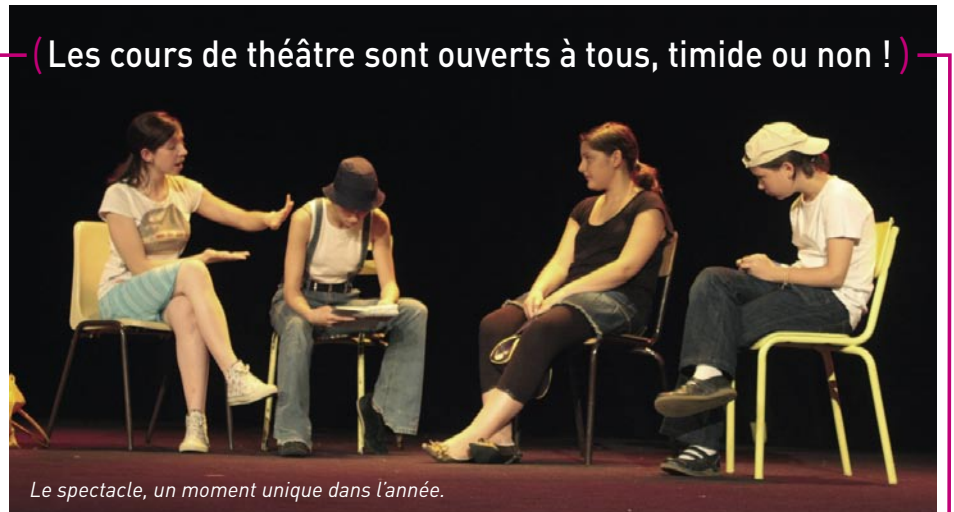
Le spectacle, un moment unique dans l'année.

( Les cours de théâtre sont ouverts à tous, timide ou non ! )