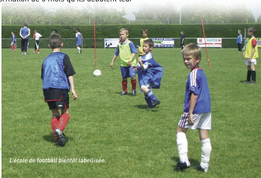
L'école de football bientôt labellisée.

Bon courage à eux trois pour cette formation et l'examen final.