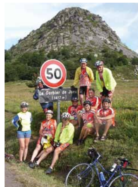
Plus de 1 000 km parcourus par les cyclistes du MAC.

Dans la partie finale, les deux derniers jours, il a bien sûr fallu grimper pour accompagner la Loire jusqu'à sa naissance, mais le sport nature n'est-il pas une bonne façon de se ressourcer ?