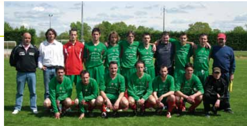
Les joueurs de l'équipe sénior A.