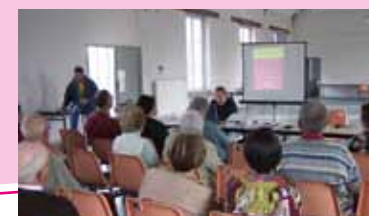
La prochaine réunion d'information aura lieu au printemps 2011